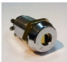
Abloy- ja ASSA-lukkojärjestelmät