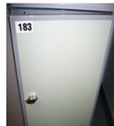
Teräsreunalla varustettu laminaattiovi