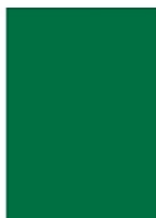
RAL 6032 Signal Green