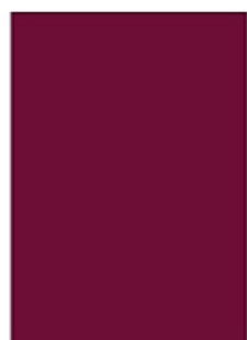
RAL 4004 Claret Violet