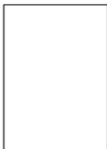
RAL 9016 Traffic White