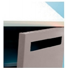
Postiluukulla varustettu ovi