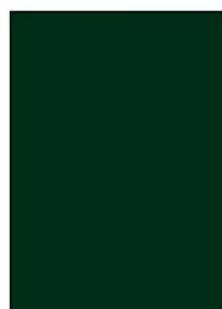
RAL 6005 Moss Green