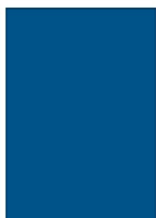
RAL 5017 Traffic Blue