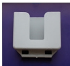
Henkilökohtaisten esineiden lipas